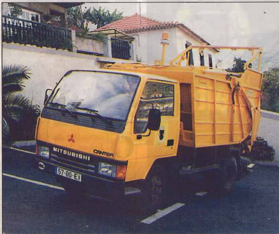
A nova viatura de remoção de resíduos sólidos tem uma capacidade de cinco metros cúbicos

O Município de Câmara de Lobos recebeu da Associação de Municípios da Região Autónoma da Madeira (AMRAM) uma viatura de remoção de resíduos sólidos de cinco metros cúbicos.