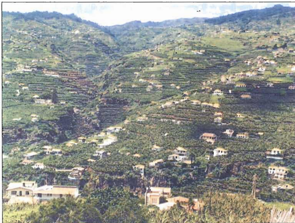
O PDM propõe a criação zonas urbanas mais concentradas

turística” do concelho, incluindo a oferta de bares e de actividades nocturnas, e o aproveitamento turístico das actividades tradicionais, como a pesca.