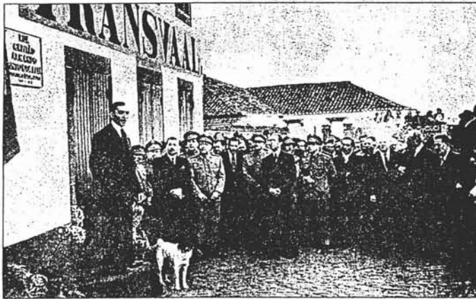
Inauguração de placas toponímicas na rua capitão Armando Pinto Correia

Ao longo de 81 domingos, sob a temática "Caminhos e lugares do concelho de Câmara de Lobos", o Jornal da Madeira publicou um conjunto de artigos, onde, a propósito de uma rua, de uma estrada ou um lugar, se tornou possível conhecer mais e melhor o concelho de Câmara de Lobos.