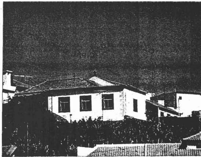
Pormenor da Capela do Espírito Santo