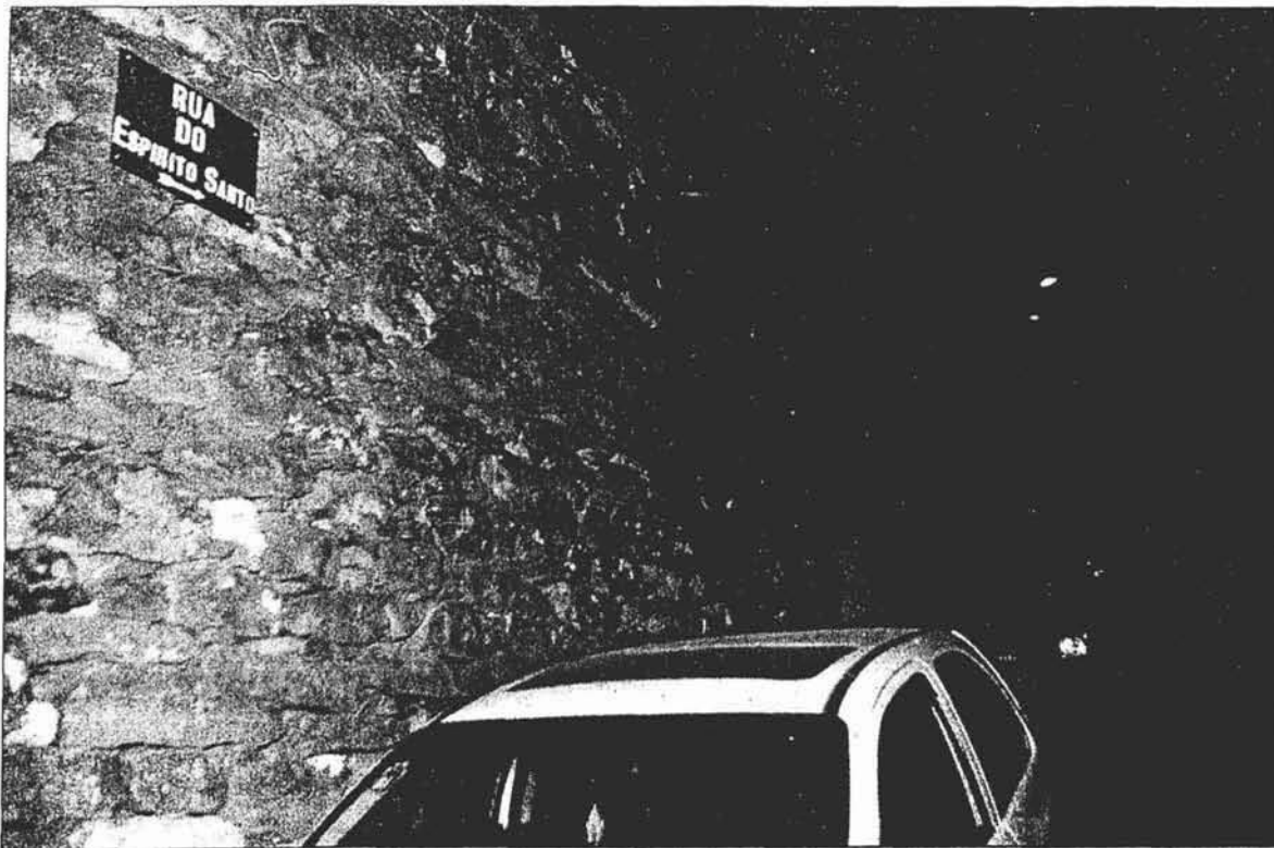
Como tantas outras esta rua também tem a sua própria história

Não sendo possível precisar o momento em que este arruamento surgiu, será no entanto lícito admitir que possa ter sido um dos primeiros que se delineou em Câmara de Lobos. A corroborar esta opinião está naturalmente a existência da capela do Espírito Santo nas proxi-