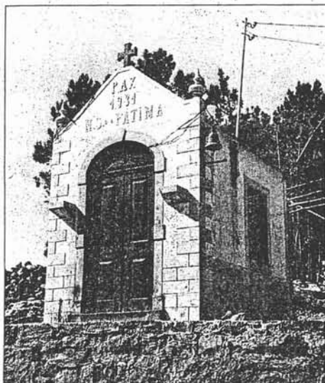
Primitiva capela de Nossa Senhora de Fátima.