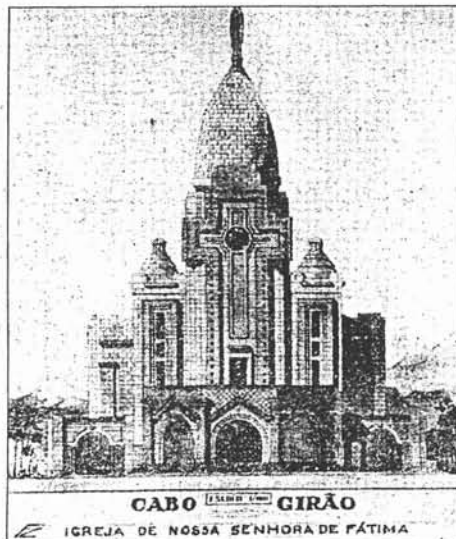
O projecto de um monumental santuário (1931-1934)